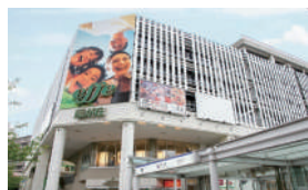
市営地下鉄「藤が丘」駅