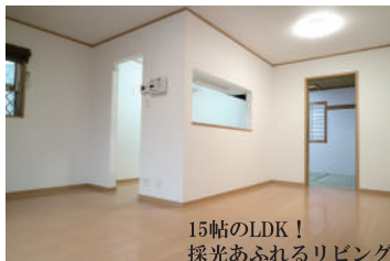
15帖のLDK！ 採光あふれるリビングで 家族の団らんのひとときを