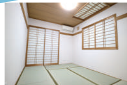
リビングから繋がる6.5帖の和室は 子供たちの遊ぶスペースやお客 様のおもてなしの部屋としても