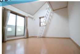
2階の洋室にはロフトが！ 収納として、ちょっとした部屋 としてさまざまな用途に