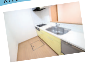
使いやすい対面式のキッチン 可動域も広くお料理が楽しめます